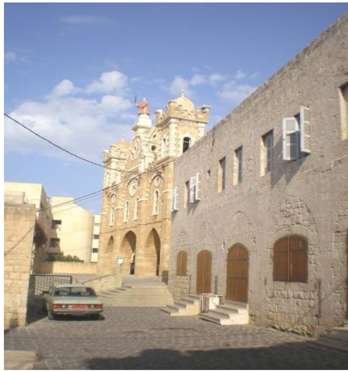
Vista de una calle de Batrun.